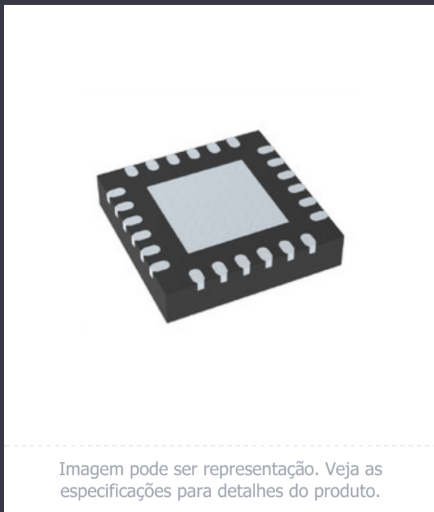
Imagem pode ser representação. Veja as especificações para detalhes do produto.