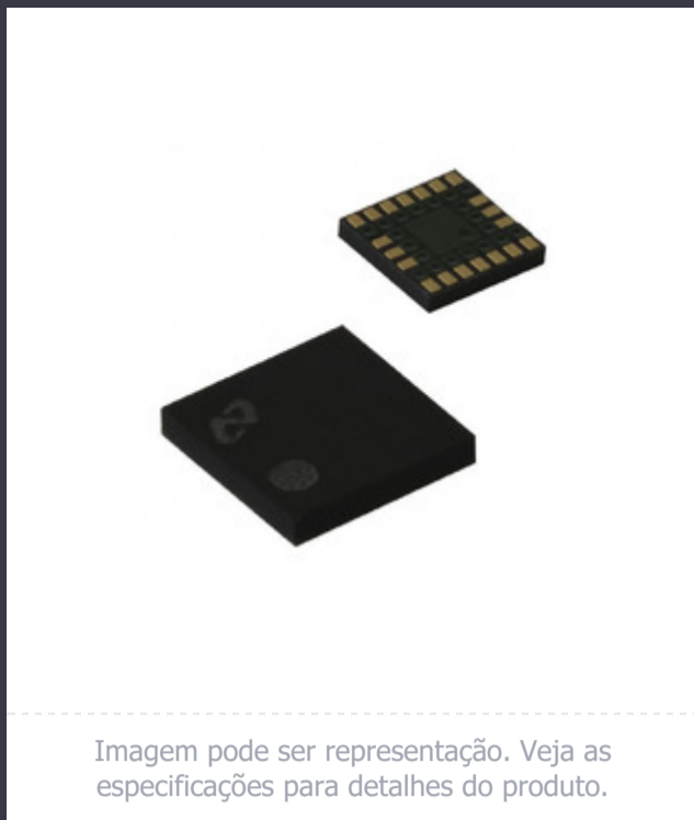
Imagem pode ser representação. Veja as especificações para detalhes do produto.