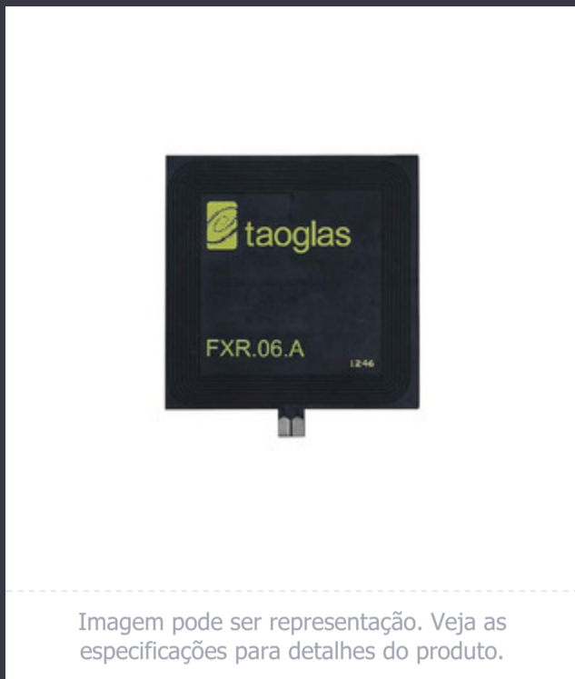
Imagem pode ser representação. Veja as especificações para detalhes do produto.