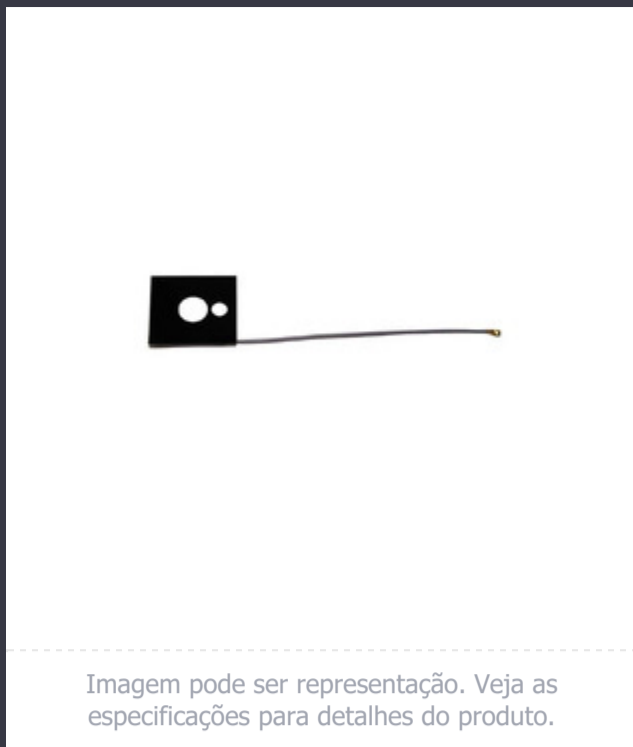
Imagem pode ser representação. Veja as especificações para detalhes do produto.