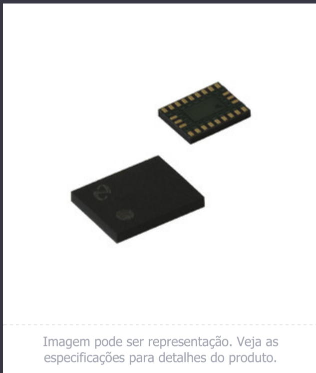
Imagem pode ser representação. Veja as especificações para detalhes do produto.