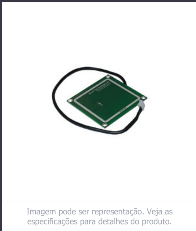
Imagem pode ser representação. Veja as especificações para detalhes do produto.