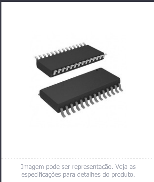
Imagem pode ser representação. Veja as especificações para detalhes do produto.